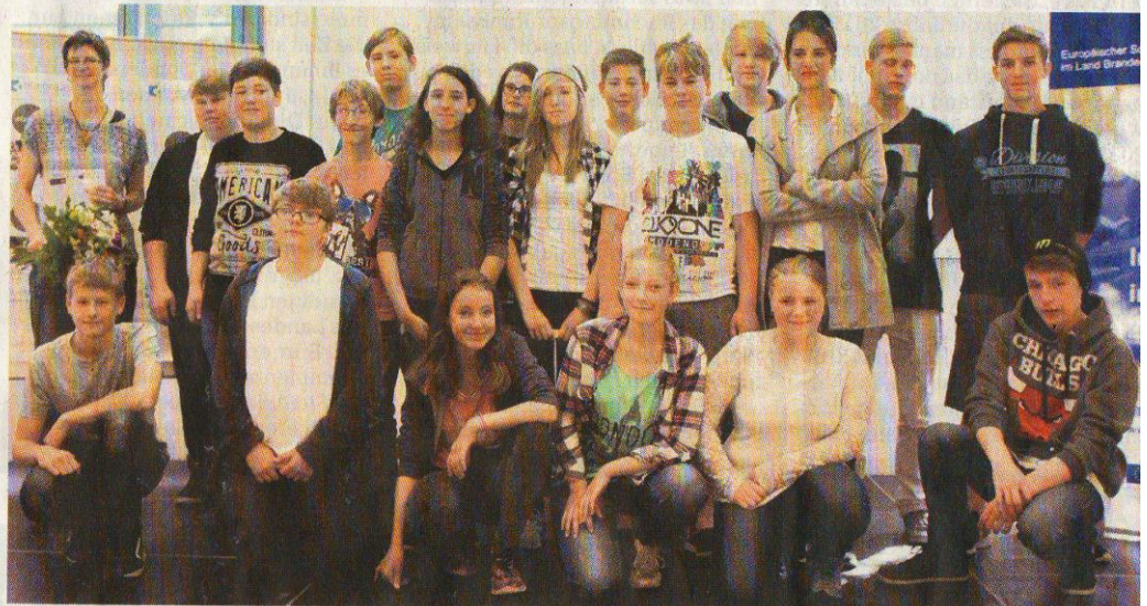
Die Schüler der Dr. Hugo Rosenthal Oberschule übten sich als Nachwuchsjournalisten.